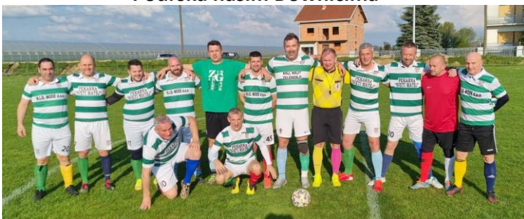
Zimzeleni + Slep